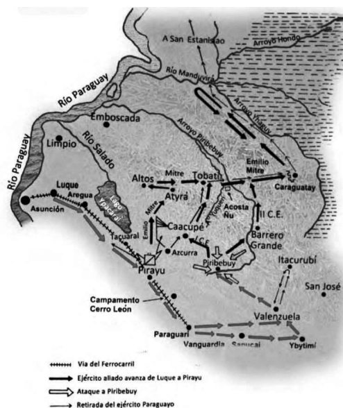
Figura 1: Campaña de Cordilleras.

Los ríos Manduvirá y Yhagüy poseían una hidrografía prácticamente desconocida y presentaban varias dificultades a la navegación: continuas bajantes de sus aguas; corrientes rápidas; caudal caprichoso y variable; curso irregular, estrecho, sinuoso y tortuoso; marcados meandros; y permanente acumulación en el lecho de árboles y demás elementos de la naturaleza circundante. Los frondosos bosques y las barrancas de las riberas eran sitios ideales para ejecutar emboscadas, golpes de mano y ataques sorpresa. La guerra costa vs. buque adquiría en ese escenario las condiciones ideales.