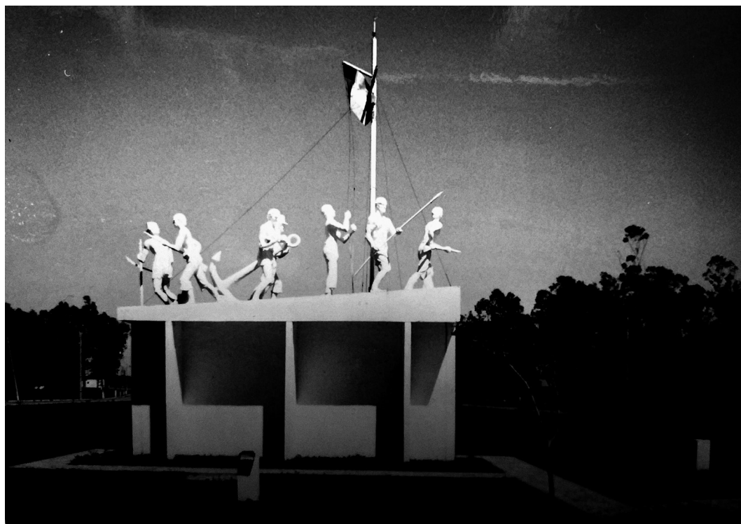
Figura 2: Monumento a los Marineros Paraguayos Héroes de Yhagüy. Parque Nacional "Vapor Cue", Paraguay. Las figuras de los 7 marineros recuerdan a los 7 vapores hundidos en la zona: Paraguarí (hundido en torno a la boca del Yhagüy en enero de 1869); y Pirabebe , Ypora , Salto del Guairá , Paraná , Río Apa , Anhambay (hundidos en el Yhagüy en la jornada decisiva del 18 de agosto de 1869). En el centro está el Pabellón Nacional al tope del mástil, sostenido por un marino y custodiado por los 6 restantes para que nadie y nada llegue a mancillarlo. Los restos de esos 6 últimos vapores son los que se han recuperado y se preservan en el Parque Nacional "Vapor Cue".